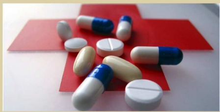
Pharmacien + Infirmière

Pendant 2 jours, des ateliers pratiques en petit groupe, encadrés par une équipe pluridisciplinaire vous aident à acquérir les ressources nécessaires pour gérer au mieux votre vie avec votre maladie et vous permettent de partager vos expériences avec d'autres patients.