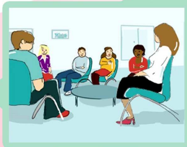
Psychologue Patient Expert